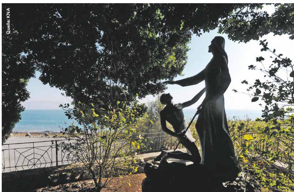
Eine Statuengruppe am Nordufer des See Genezareth in Galiläa stellt die Berufung des Petrus zum Hirten der Kirche dar. Hier soll Jesus nach seiner Auferstehung seinen Jüngern erschienen sein.