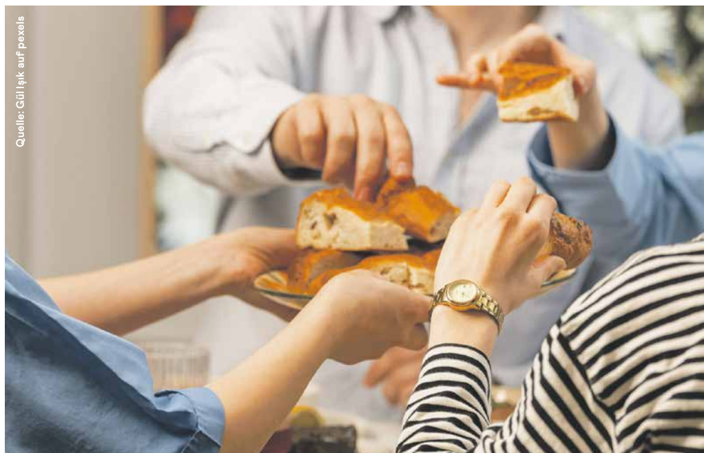
Beim Brechen und Teilen des Brotes haben die Jünger im fremden Mann den auferstandenen Jesus erkannt. So lesen wir es im Neuen Testament.

Die ersten Christinnen und Christen begannen in Jesus den «Christos», den Gesalbten, auf Hebräisch «Maschiach», aus dem das Wort «Messias» wurde, zu sehen. Der Glaube daran, dass Jesus auferstanden ist, führte dazu, dass sie die Ankündigungen des Messias in der Hei-