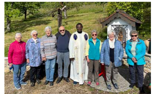
Rückblick - Maiandacht Bildstöckli 19. Mai