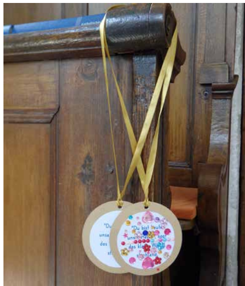
Medaille vom kleinen Waschbären