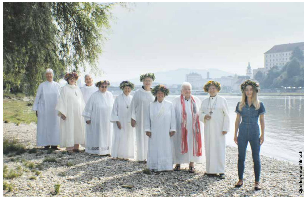
Inna Shevchenko trifft römisch-katholische Priesterinnen in Linz an der Donau. Filmbild aus «Girls and Gods»