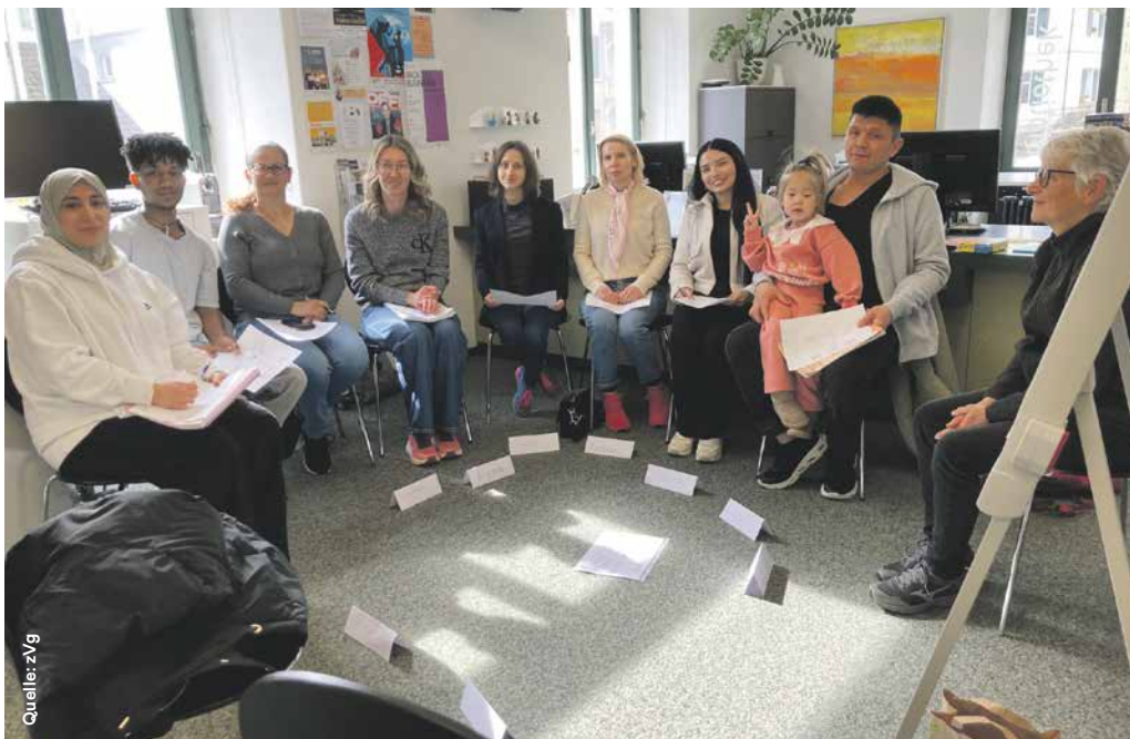
Im Deutschkurs lernen die Geflüchteten, sich in Alltagssituationen zu verständigen.