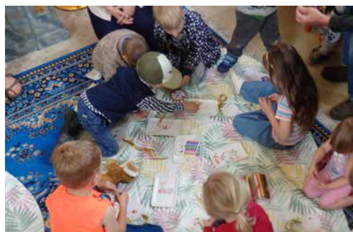
Die Kinder beim Medaillen basteln