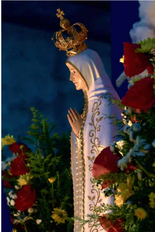
Ave Maria / Mission Maria

Wie die Geschichte besagt erschien die Jungfrau Maria in der portugiesischen Stadt Fatima drei Hirtenkinder mit verschiedenen Botschaften. Bis heute ist die Faszination der Mutter Maria ungebrochen.