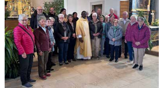
Rückblick - Bittgang 13. Mai

weitere Anliegen kontaktieren Sie bitte die zuständige Kontaktperson Ihrer Pfarrei. Das Sekretariat des Seelsorgeverbandes ist montags und dienstags offen. Gerne können Sie eine Nachricht auf dem Anrufbeantworter hinterlassen; wir melden uns baldmöglichst bei Ihnen.