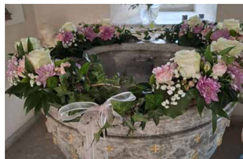
Taufbecken, geschmückt von Karin Felix

Wir wünschen der jungen Familie einen unvergesslichen Tauftag und für die Zukunft alles Liebe und Gottes Segen. Behüt euch Gott!