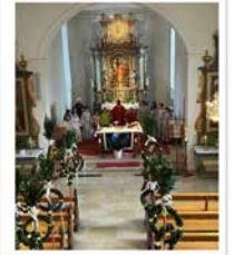
Herzlichen Dank Minis für die schönen Palmen