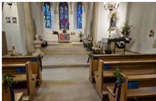
Die geschmückte Kirche Dittingen am Palmsonntag

Wir bedanken uns bei allen, welche zum Gelingen der Anlässe von Palmsonntag bis Ostern im Pastoralraum beigetragen haben.