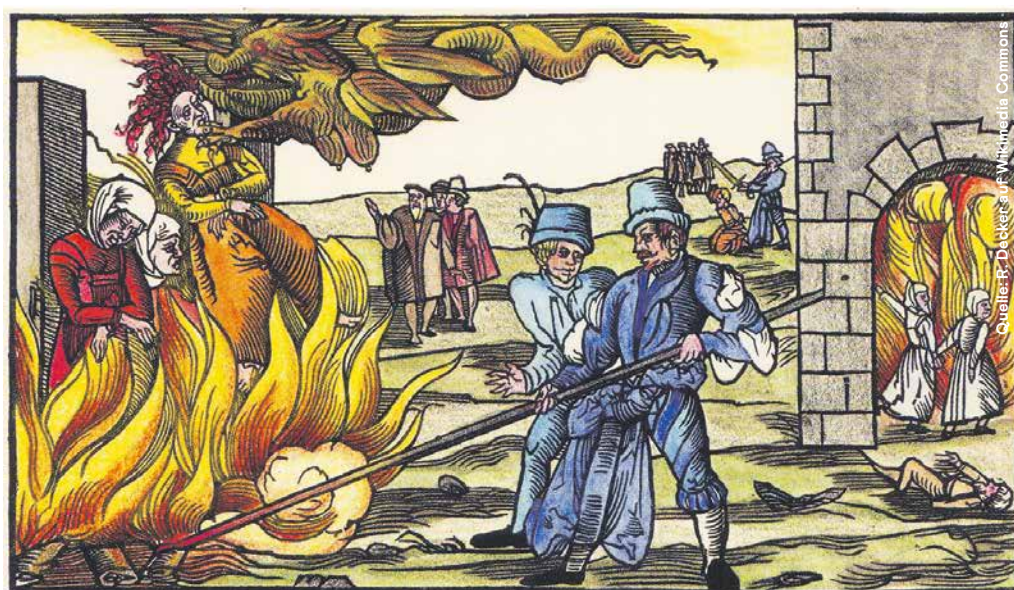
Abdruck in einer Zeitung zu einer Hexenverbrennung in Derenburg (Deutschland) aus dem Jahr 1555.

Am Anfang ihrer Geschichte wird den Christinnen und Christen Ungeheuerliches angehängt: Sie sollen Rom angezündet haben. Im Jahr 64 nach Christus brennen viele Quartiere der Stadt, die Zerstörung ist gross. Der damalige Kaiser Nero lenkt das Misstrauen der Bevölkerung auf eine damals neue, kleine Religion: das Christentum. Die Christinnen und Christen werden der Brandstiftung beschuldigt, es kommt zu Verhaftungen und brutalen Hinrichtungen. Viele erleiden eine damals wohl übliche Todesstrafe für Brandstifter: Sie werden als menschliche Fackeln benutzt, um im Dunkeln die Strassen zu beleuchten. Im Clemensbrief, einer frühen christlichen Quelle, wird darauf hingewiesen, dass auch Petrus und Paulus während dieser Hinrichtungswelle getötet wurden. Aber auch nicht-christliche Quellen bezeugen das Vorgehen gegen Christinnen und Christen. Sueton, ein römischer Schriftsteller und Verwaltungsbeamter, der dies als eine gute Sache ansieht, schreibt: «Mit Todesurteilen ging man gegen Christen vor, eine Menschengattung, die sich einem neuen und ruchlosen Aberglauben hingegen gegeben hatte.» Man geht heute davon aus, dass Nero die Brandstiftung selbst veranlasst hat, da er ein Interesse daran hatte, die alten, übelriechenden Stadteile zu zerstören. Er schaffte es aber, die Schuld den Christinnen und Christen zuzuschreiben, weil sie im Volk nicht beliebt waren.