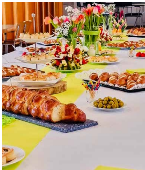
Apéro nach dem Erstkommunionsgottesdienst