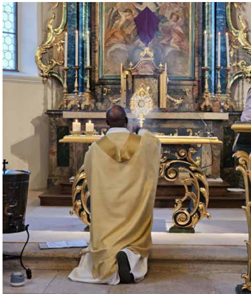
Gottesdienst am Gründonnerstag in Blauen