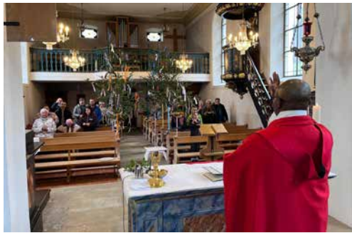
Palmsonntagsgottesdienst in Nenzlingen