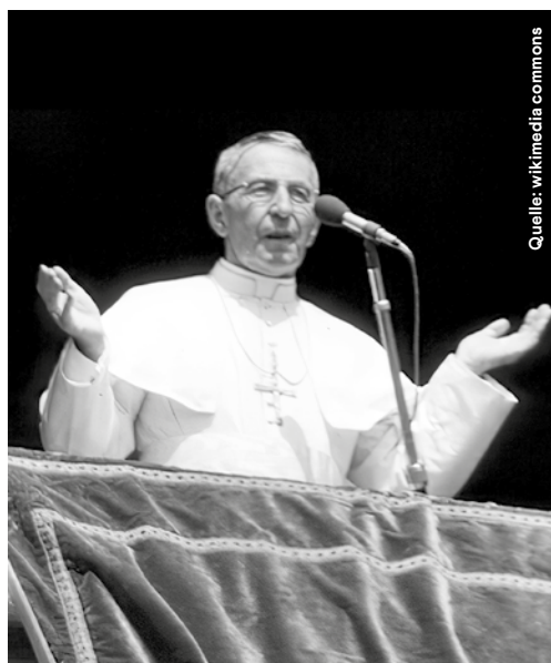
Papst Johannes Paul I.

Die Rehabilitierung der damals als Hexen getöteten Frauen beginnt spät: Erst in diesem Jahrtausend kommt es in der Schweiz zu formellen Rehabilitierungen. Im Jahr 2019 bei-