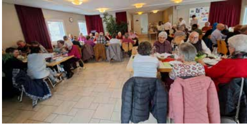
gemütliches Beisammensein mit guten Gesprächen