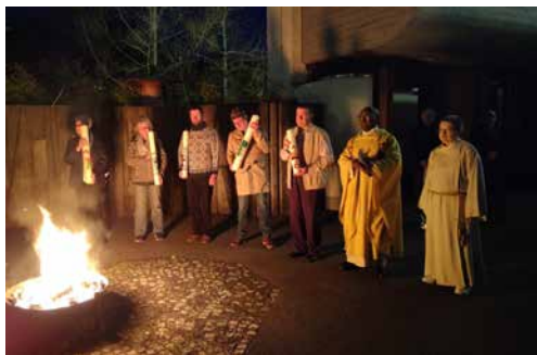
Osternacht in Zwingen