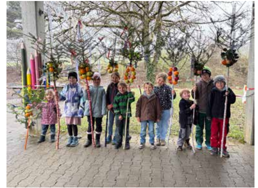
Die schönen Palmen von Himmelried