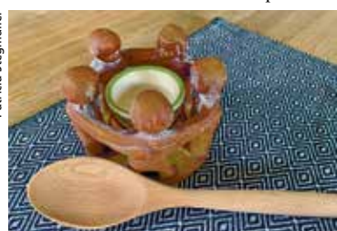
Die Liturgiegruppe lädt auch nächstes Jahr wieder zu Tisch!