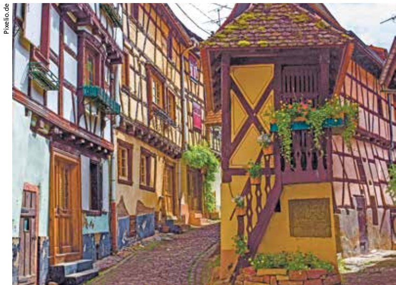
Auf der Seniorenreise kann man die idyllischen Fachwerkhäuser in Eguisheim im Elsass geniessen.